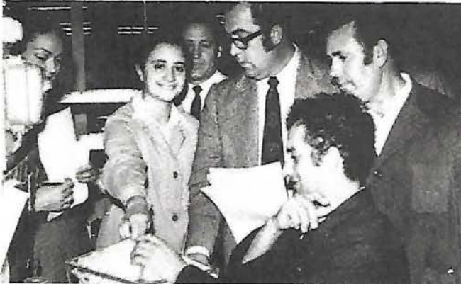
Aspecto gráfico del interés que despertó la elección de la nueva Junta Directiva del Grupo de Empresa de Educación y Descanso

El día 26 de octubre se celebró la elección de la Junta Directiva del Grupo de Empresa. Hemos de destacar que reinó el mejor ambiente y que, votaron 593 de un censo de 780 trabajadores. Sólo se anulaban 20 papeletas por haberse depositado en blanco o por contener diversos errores.