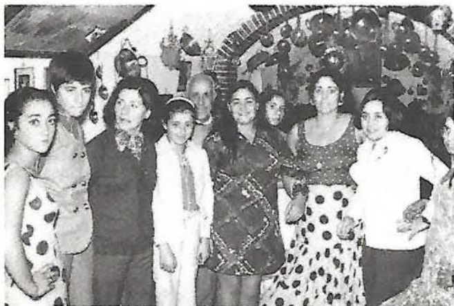
Varios compañeros y sus familiares en camaradería con los «calés»

Conforme anunciábamos en nuestro número pasado, se celebró una excursión a Granada que, por falta de espacio, no pudimos dar detalle. Tuvo lugar el día 29 de septiembre, en que salimos de fábrica y llegamos a la bella capital andaluza por la noche. El día siguiente lo dedicamos completamente a visitar el Generalife, la Alhambra, la Cartuja de Miraflores, Capilla Real y Catedral, y por la noche nos quedaron arrestos