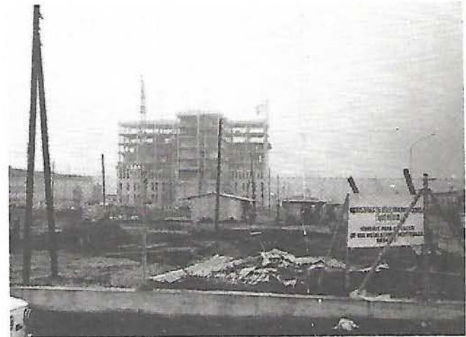
Vista parcial del estado actual de las obras, en la fecha de cubierta de aguas