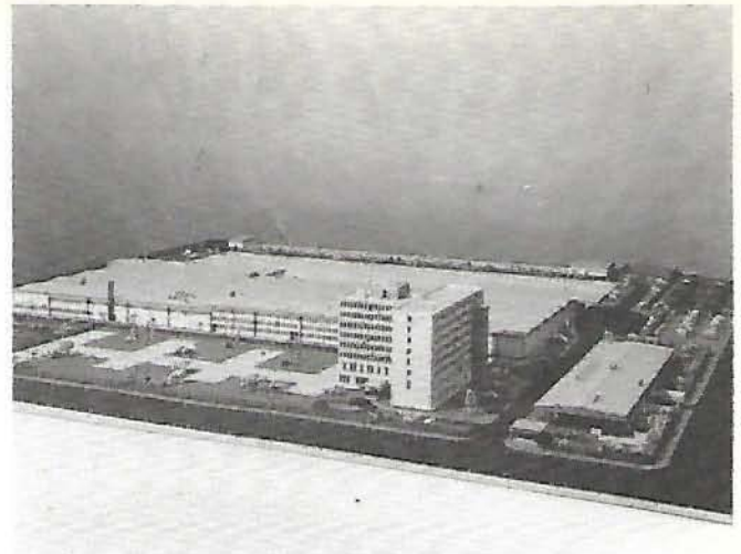
Maqueta de la nueva fábrica en el Polígono Industrial de Leganés.

En el próximo número informaremos, detalladamente, de su avanzada construcción.