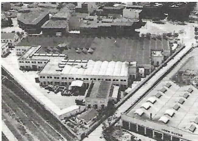
Vista aérea de la Empresa en Getafe (Madrid).

Centrales Telefónicas Automáticas de Abonados. —Tienen carácter privado. Sirven para intercomunicarse los usuarios en el interior de su domicilio y de éste con el exterior.