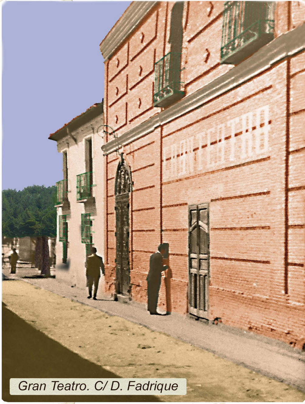
Gran Teatro. C/ D. Fadrique