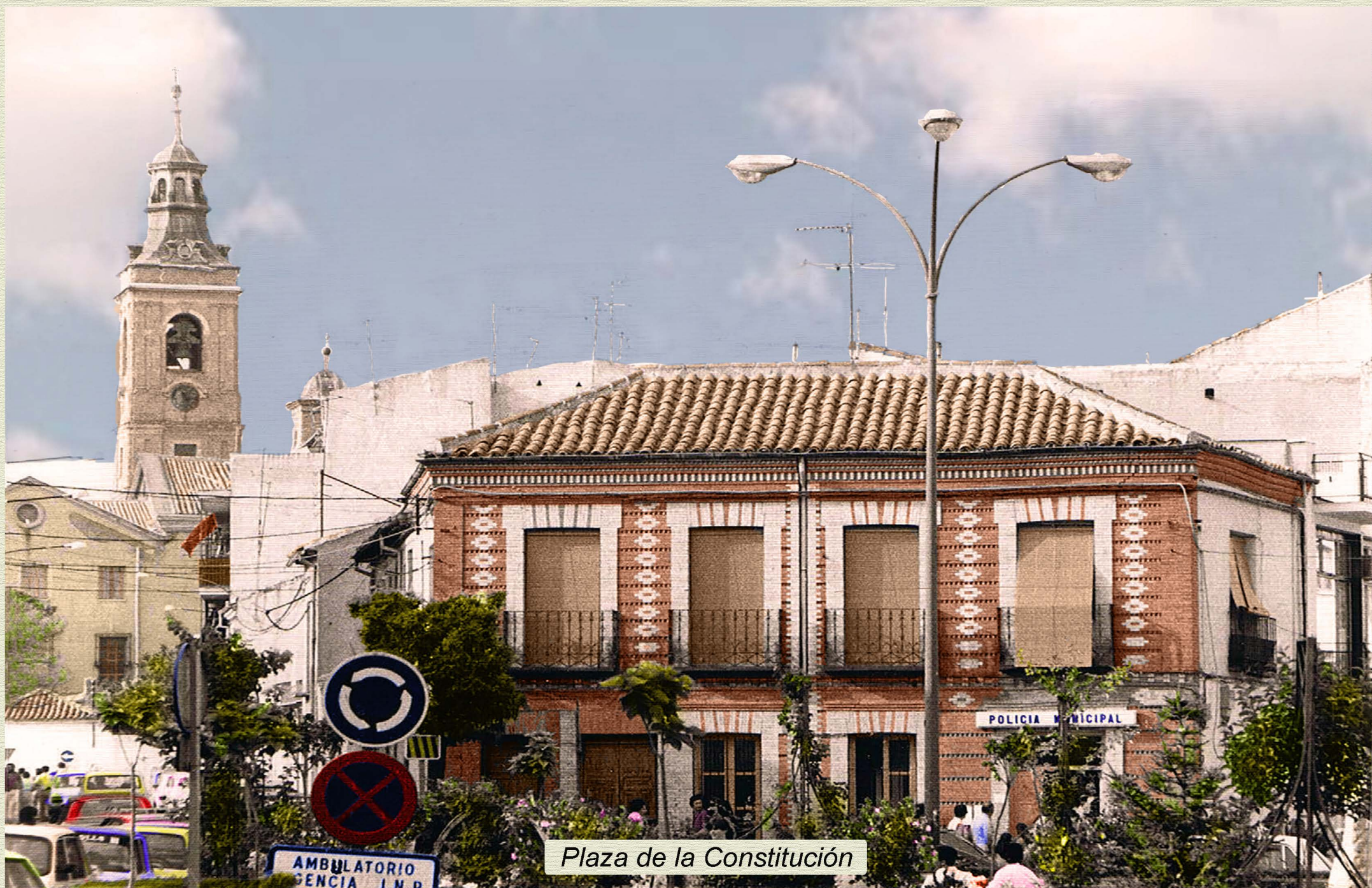
Plaza de la Constitución