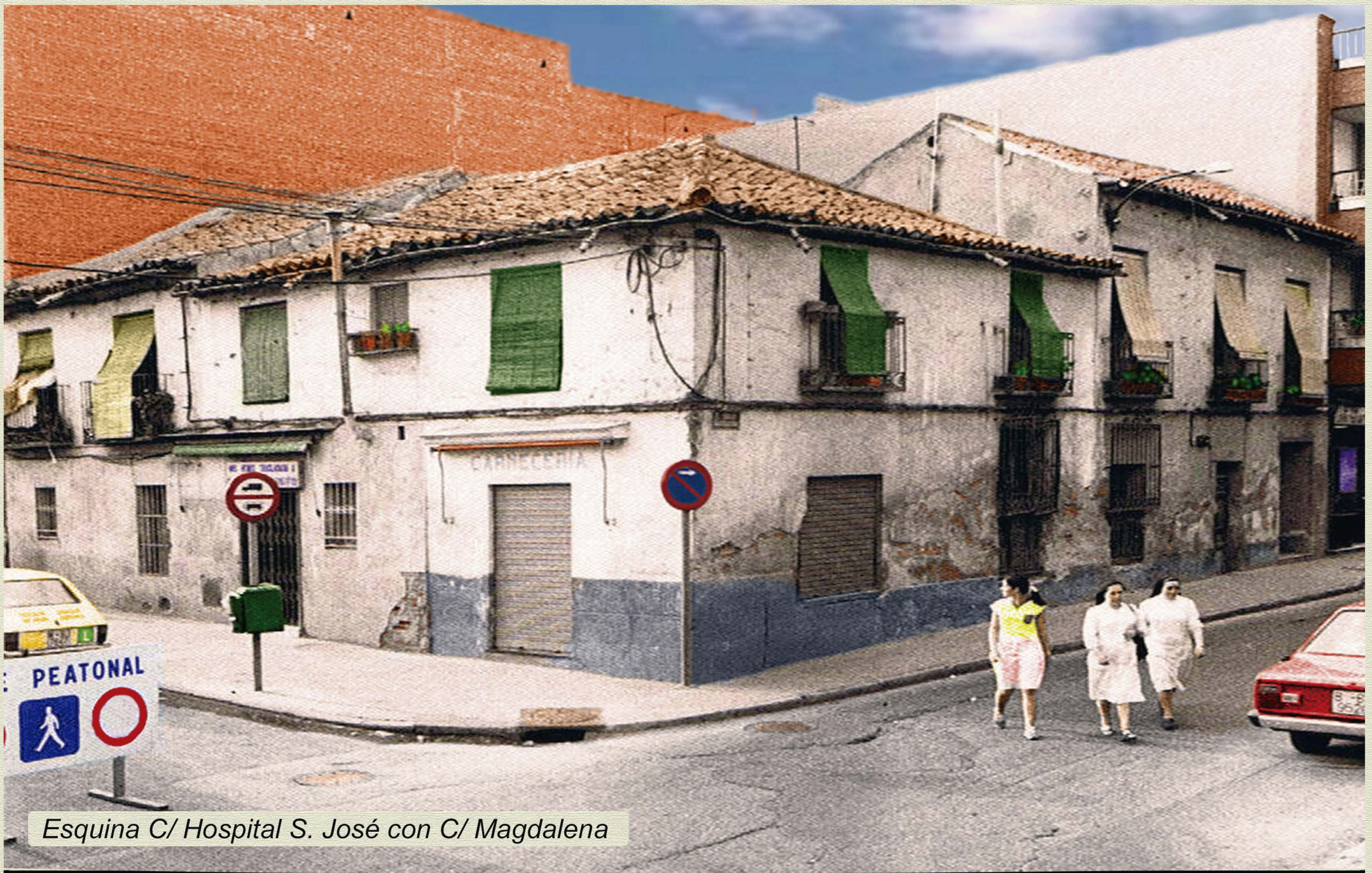
Esquina C/ Hospital S. José con C/ Magdalena