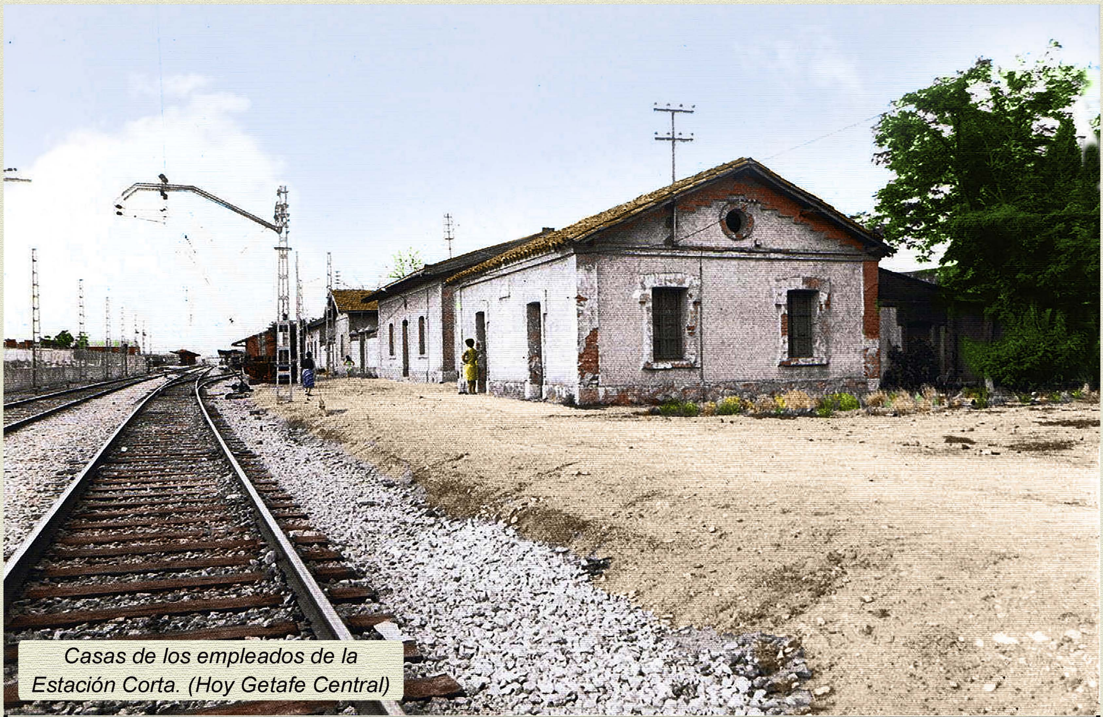
Casas de los empleados de la Estación Corta. (Hoy Getafe Central)