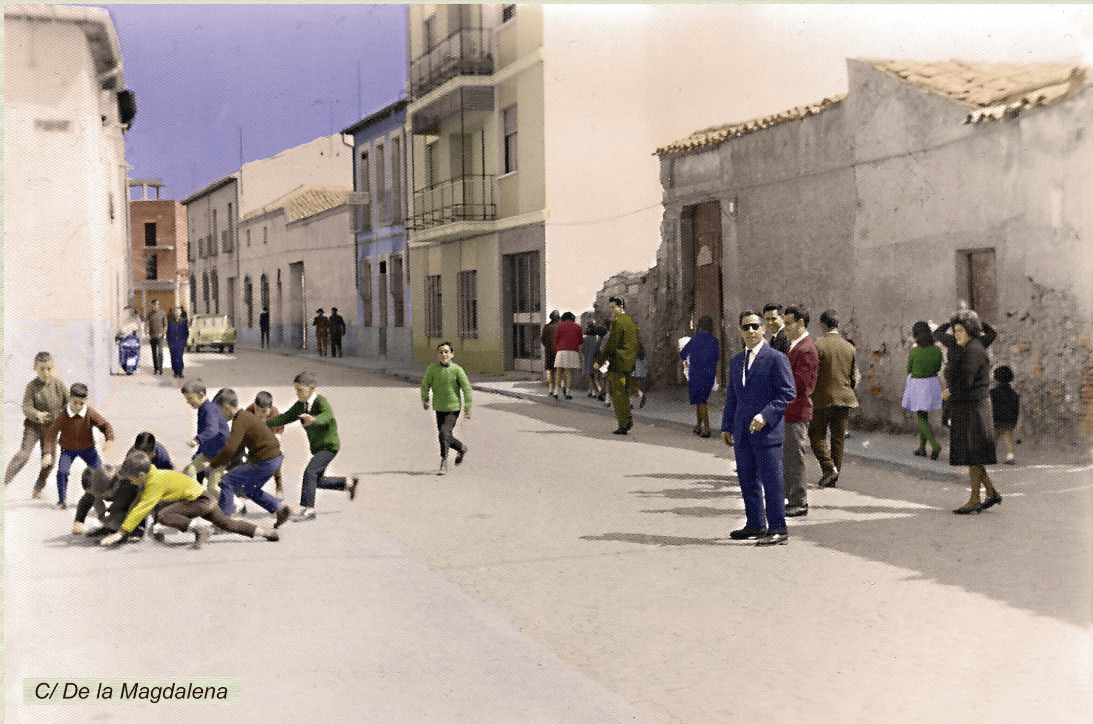
C/ De la Magdalena