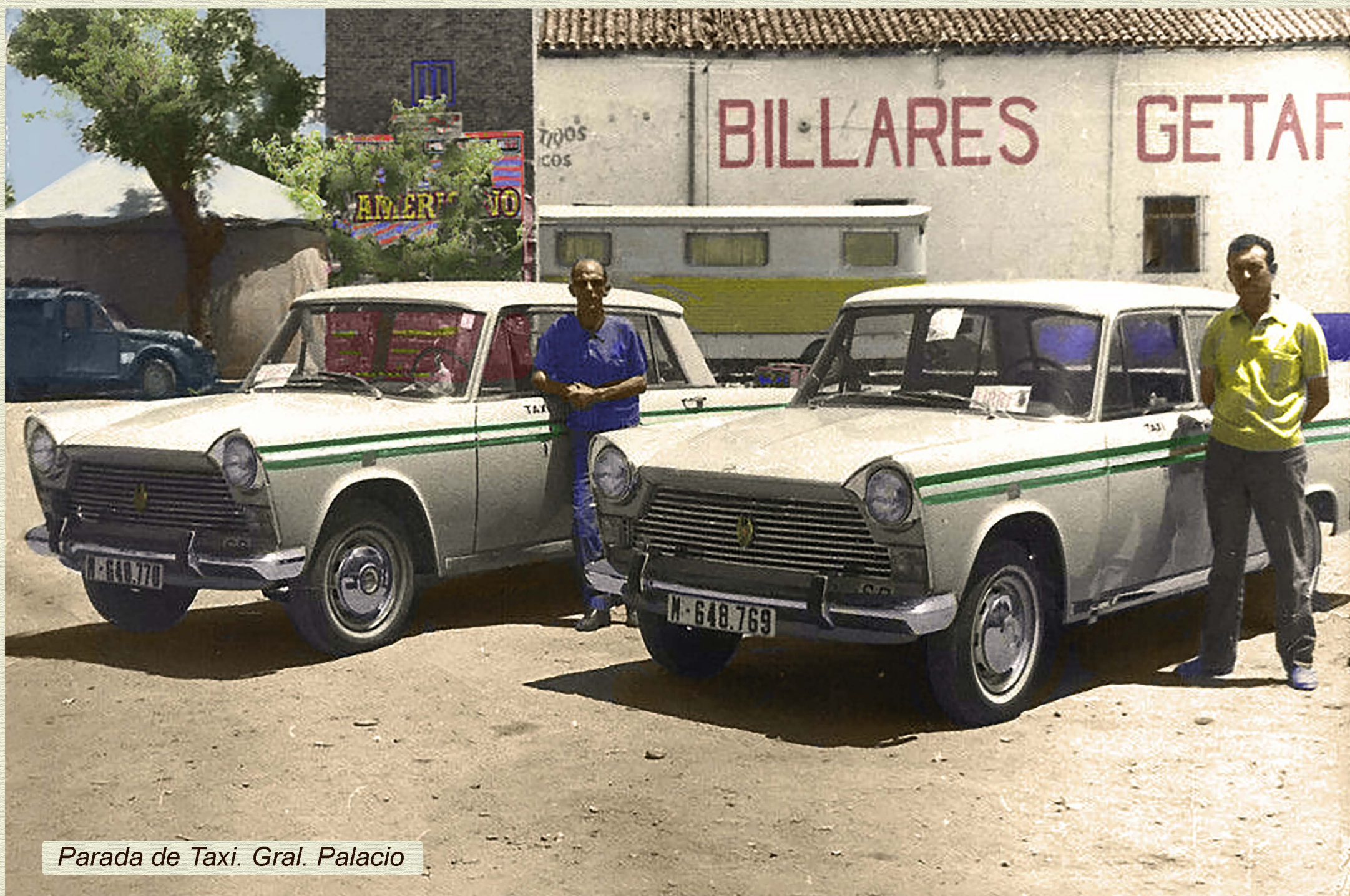
Parada de Taxi. Gral. Palacio