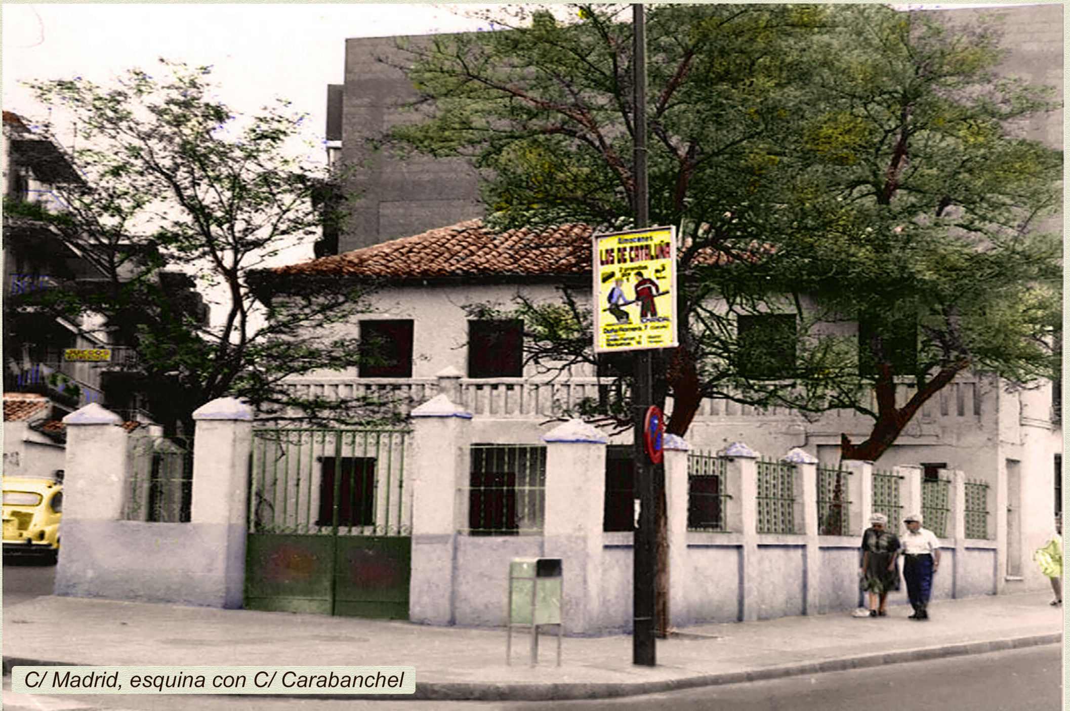
C/ Madrid, esquina con C/ Carabanchel