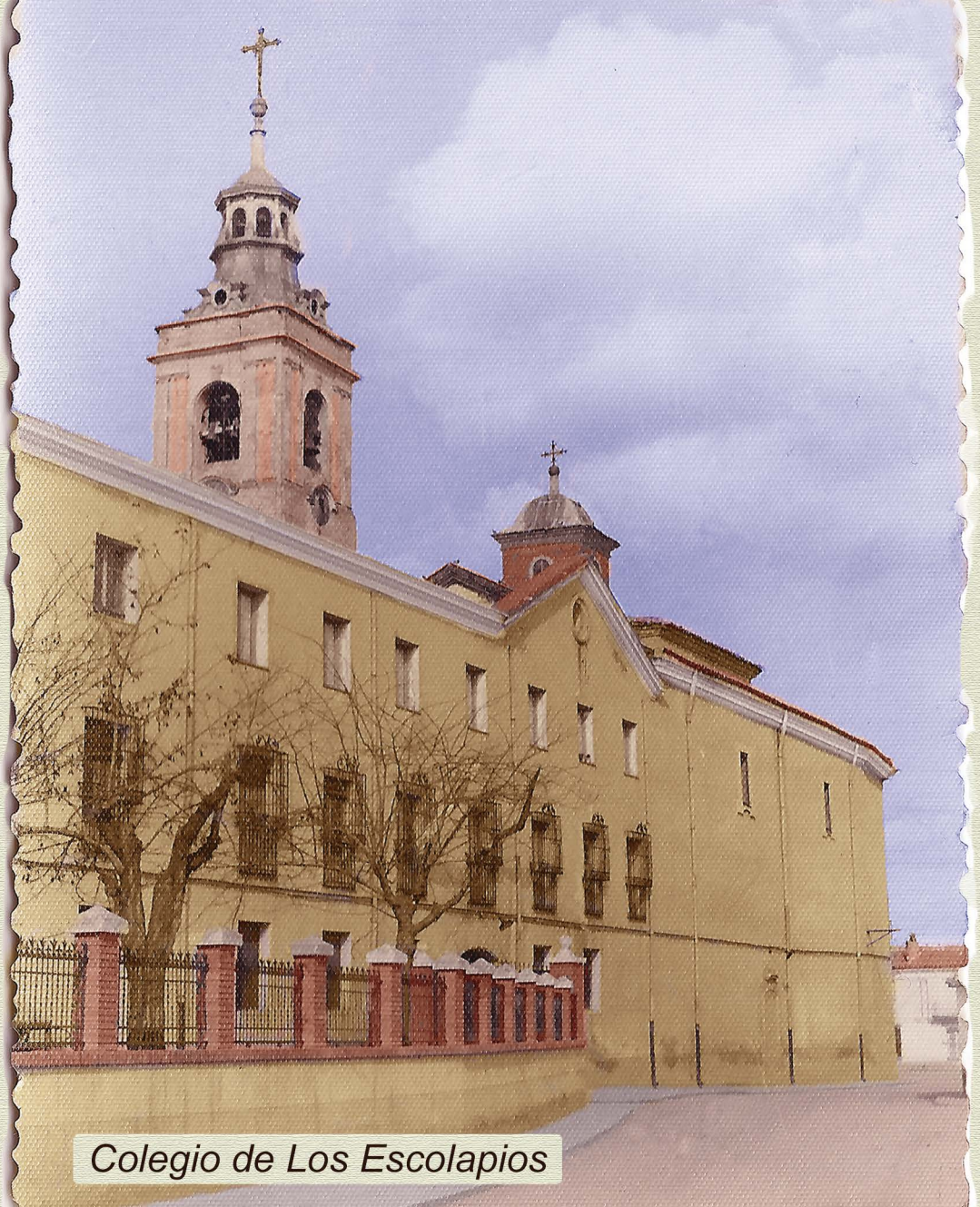
Colegio de Los Escolapios