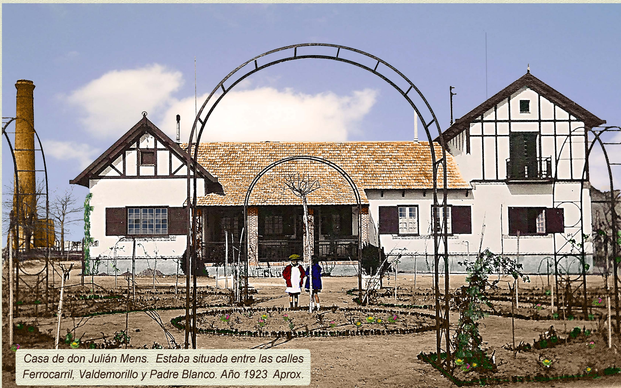
Casa de don Julián Mens. Estaba situada entre las calles Ferrocarril, Valdemorillo y Padre Blanco. Año 1923 Aprox.