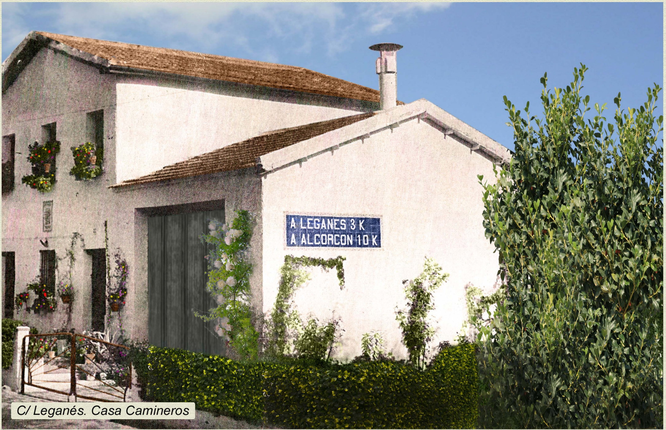
C/ Leganés. Casa Camineros