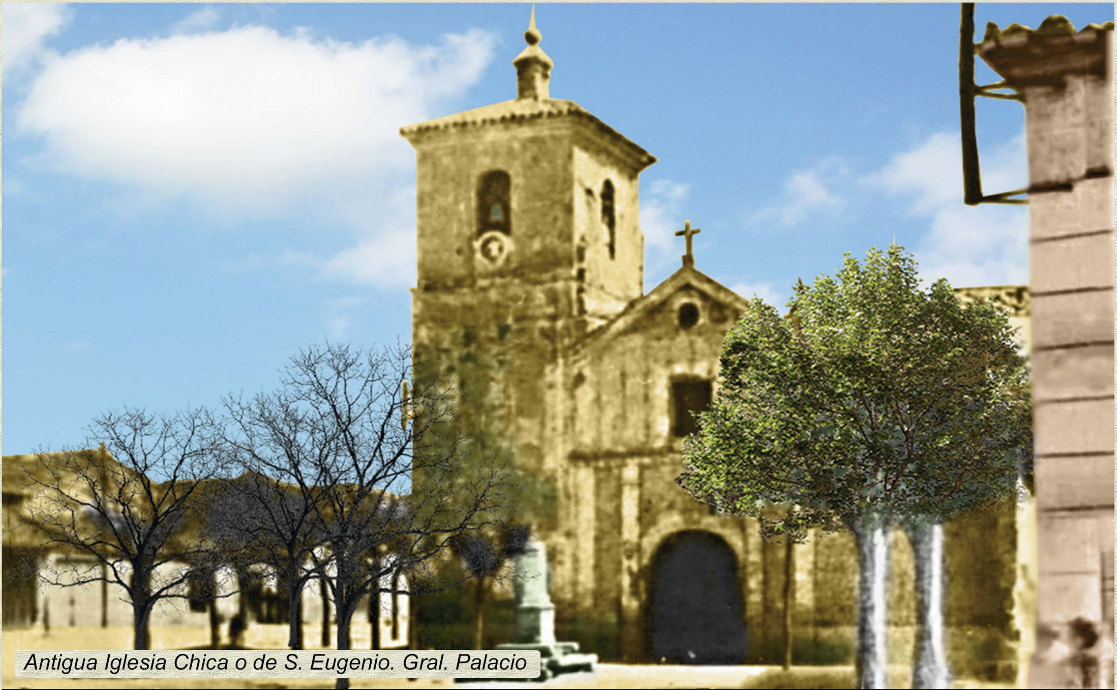
Antigua Iglesia Chica o de S. Eugenio. Gral. Palacio