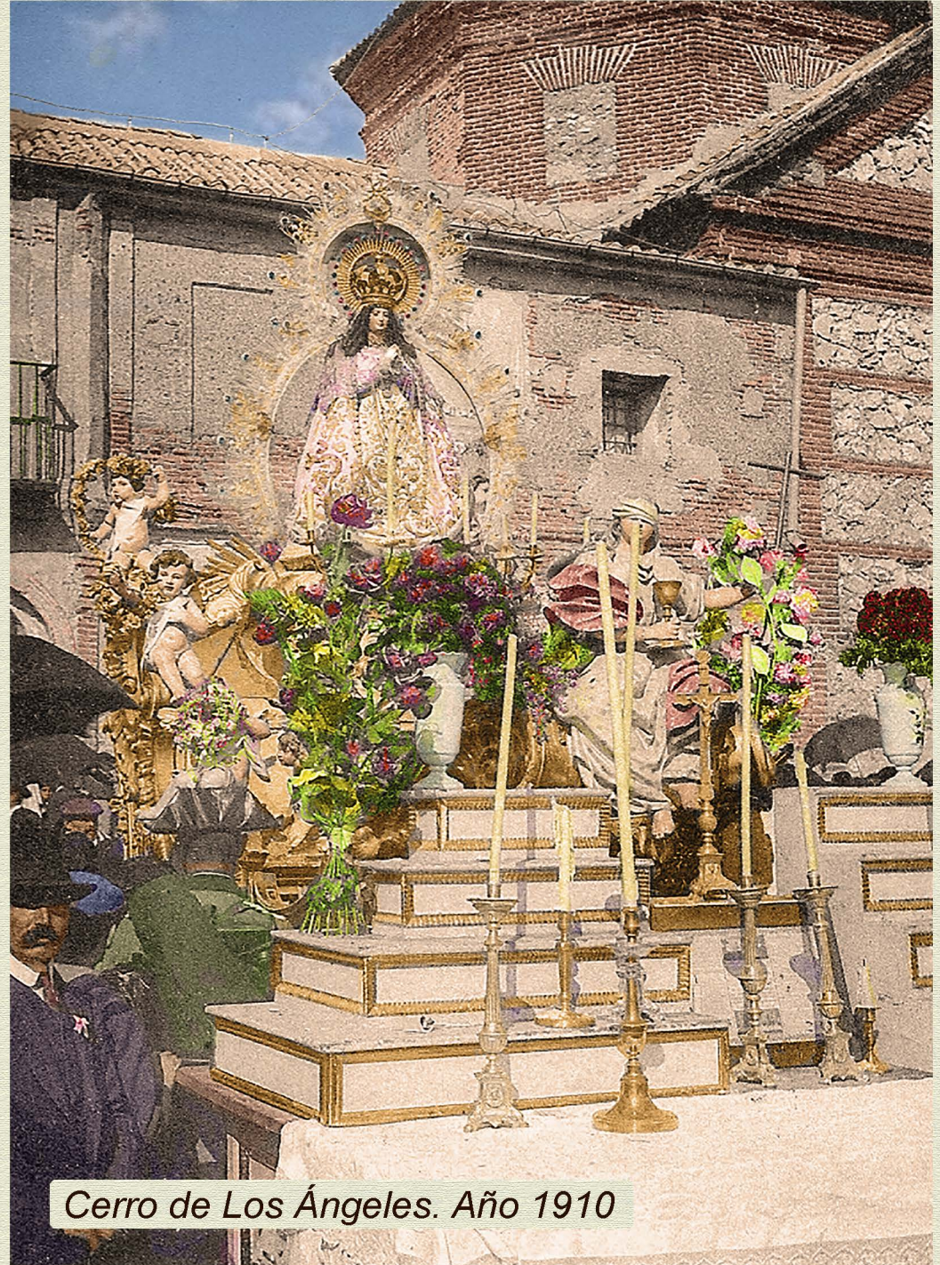
Cerro de Los Ángeles. Año 1910