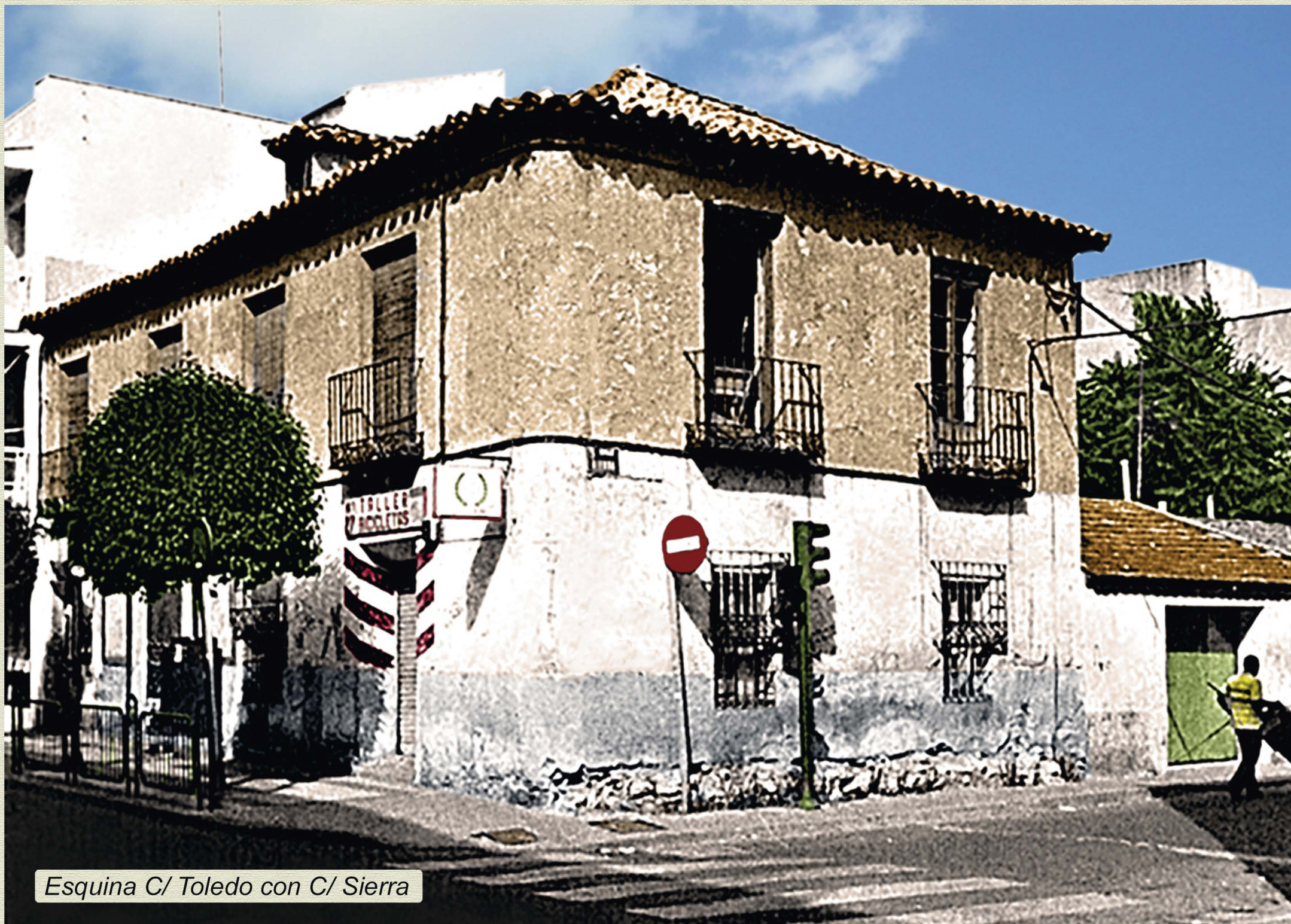
Esquina C/ Toledo con C/ Sierra