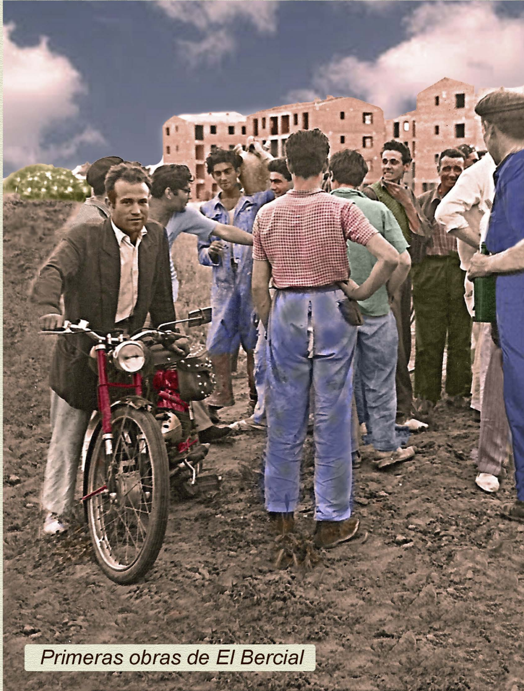
Primeras obras de El Bercial