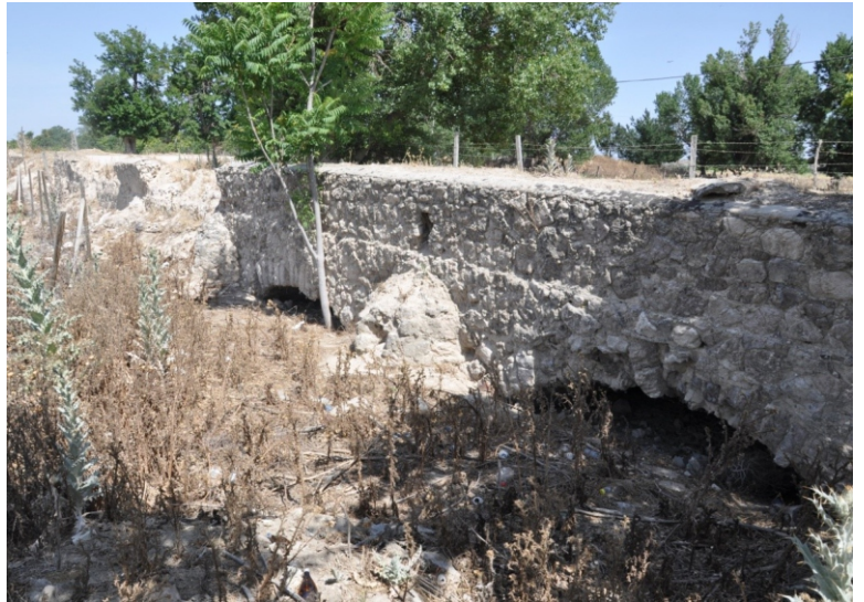
FOTO ACTUAL DEL PUENTE DE LA ALDEHUELA, COLMATADO Y MUY DETERIORADO (AUTOR: JOSÉ EXPÓSITO)

Su estado actual. Se encuentra ubicado a unos 800 metros del río Manzanares, tiene una longitud aproximada de unos 70 mts. Se encuentra prácticamente cubierto por los sedimentos del cauce de dicho arroyo, pero aun pueden verse dos de sus cuatro ojos y sus tajamares triangulares. La desviación actual del cauce del Culebro, para dar servicio a la depuradora Sur (EDAR Culebro) y la construcción cerca del mismo, de otro puente para poder pasar por el nuevo cauce, lo han dejado en un excauce seco y totalmente oculto por la maleza, por lo que sería necesaria su recuperación y protección.