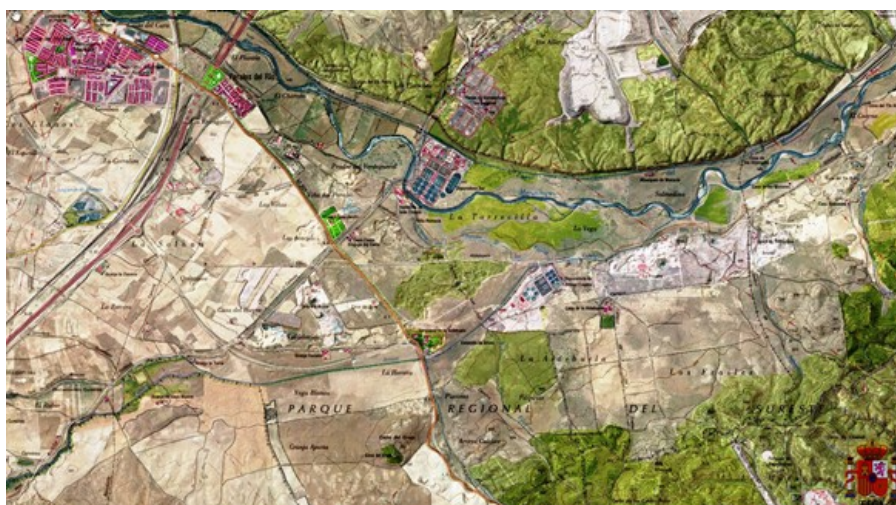
LA FINCA DE LA ALDEHUELA HOY EN DÍA - SIGPAC

En el año 1850, Madoz, en su Diccionario sobre los pueblos de España, dice: La Aldehuela, dehesa y soto en la provincia de Madrid, Partido Judicial y término de Getafe, situado a 2,5 leguas de la capital y a media de la del Partido y media más debajo de la de Perales del Río. Confina con la novena esclusa del Real Canal del Manzanares. Comprende una media legua de extensión, con tierras de pasto, labor y arbolado para leña. Perteneció a la Hacienda de Gozquez, de los Monjes del Escorial y en su día al Real Patrimonio.