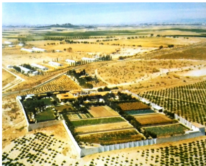
EL CONVENTO DE CARMELITAS DESCALZAS

Quiero dejar claro, porque sé que hay bastante confusión con este tema, que además de los restos del monasterio de la Trapa del Val de San José, dentro de la misma finca y a menos de dos km uno del otro, podemos encontrar un convento de monjas, de las Carmelitas Descalzas de La Aldehuela, del que os haré un breve relato a continuación.