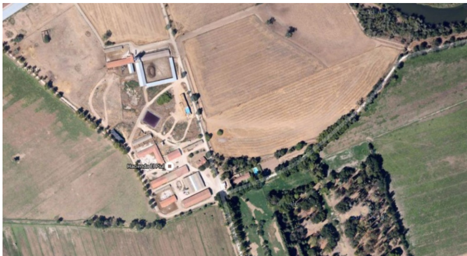
PLANO DE LA ÉPOCA Y FOTO DEL SOTO DE PIUL