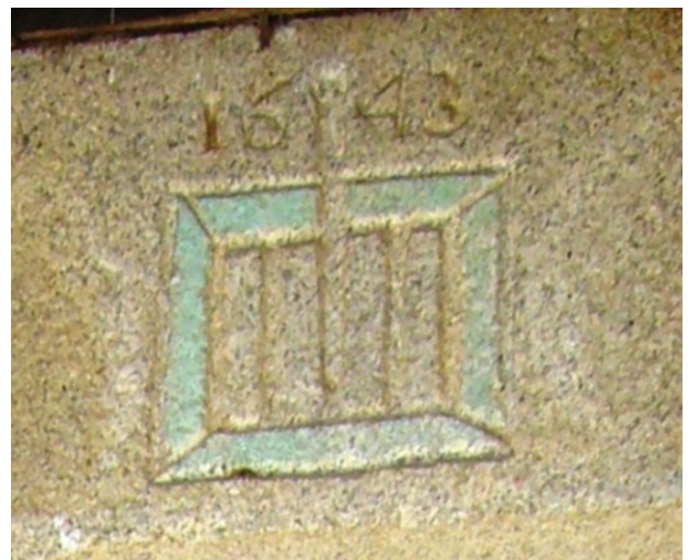
PARRILLA DE SAN LORENZO. DETALLE DE LA PORTADA DE GOZQUEZ

Aquí tenemos la prueba y la razón por la que aún hay mojones en Getafe de tierras que fueron del Escorial.