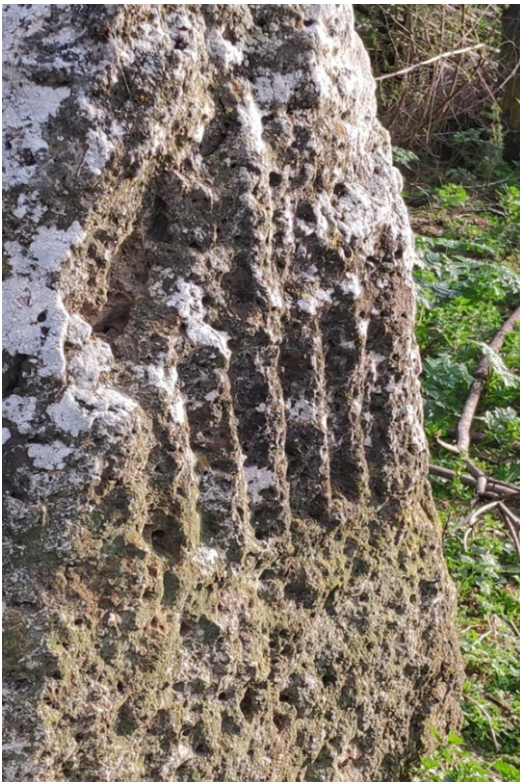
MOJONES DE LA FINCA DE LA ALDEHUELA CON LA PARRILLA DE SAN LORENZO (AUTOR: MANUEL MONTERO)