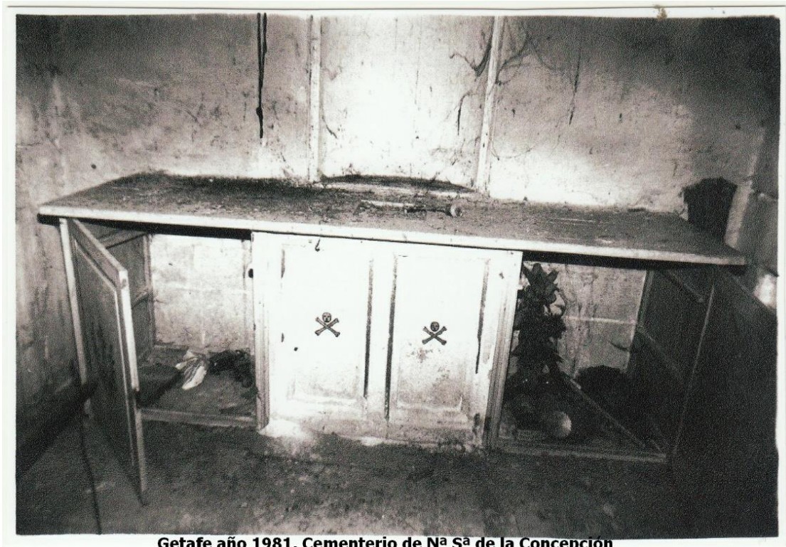
Getafe año 1981, Cementerio de N a S a de la Concepción