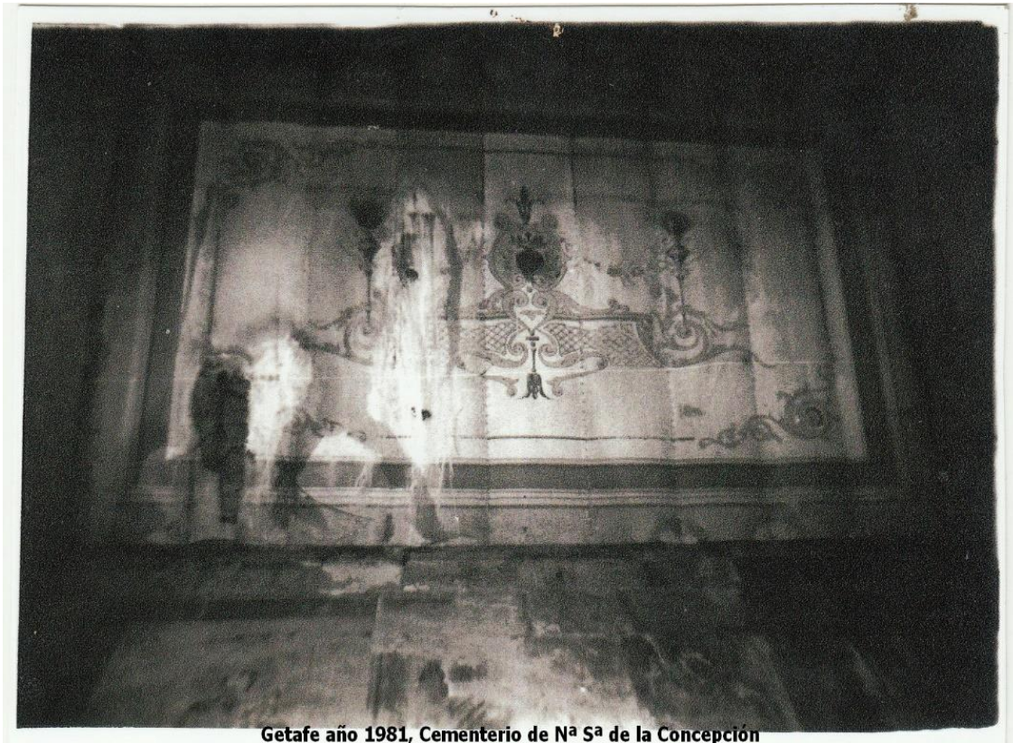
Getafe año 1981, Cementerio de N a S a de la Concepción